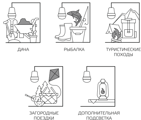
Рис.3. Сферы применения светильников