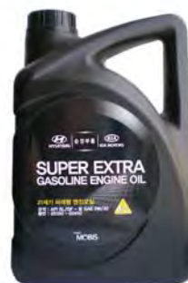
Оригинальный номер 4 л - 05100-00410