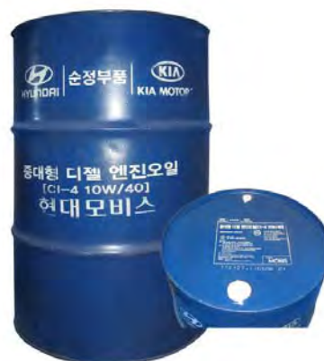
200 л - 05200-48CA0