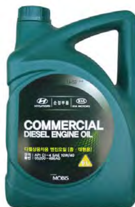
6 л – 05200-486A0