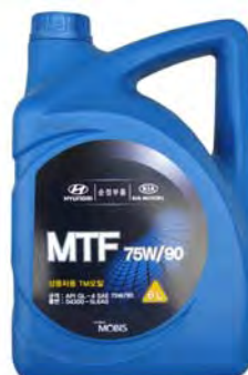
6 л - 04300-5L6A0

Синтетическое трансмиссионное масло Gear Oil SAE75W-90 создано на основе специально составленной композиции базовых масел и тщательно сбалансированного пакета высокоэффективных присадок. Оно подходит для использования в механических коробках передач и редукторах рулевых механизмов. Класс по API GL-3/4.