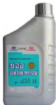
1 л - 05100-00141

Современное синтетическое энергосберегающее моторное масло, рекомендованное к всесезонному применению в двигателях автомобилей Hyundai и Kia с турбонаддувом и без него. Обязательно к применению для обеспечения устойчивой работы двигателей с CVVT (система изменения фаз газораспределения выпуска компании Hyundai), начиная с моделей двигателей 2L Beta I4 (автомобили Hyundai Elantra и Kia Spectra с 2005 года выпуска), Alpha II DOHC (автомобили Hyundai Accent\Verano, Tiburon, Kia Sorento с 2006 года выпуска). Отличные температурно-вязкостные характеристики обеспечивают надежную защиту двигателя от износа во всем диапазоне рабочих температур. Синтетическая основа масла обеспечивает лёгкий холодный пуск двигателя даже при экстремально низких температурах. Высокая стабильность вязкостных характеристик в течение всего срока службы способствует экономии топлива. Не оказывает вредного воздействия на самые современные системы очистки выхлопных газов. Категории API SM, ILSAC GF-4, ACEA A3