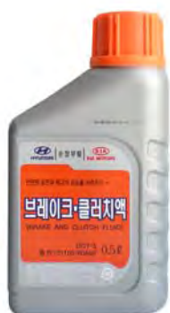
0,5 л - 01100-00A00

Тормозная жидкость уровня качества DOT-3 для тормозных систем автомобилей Hyundai, KIA концерна Hyundai Motor Company (HMC).