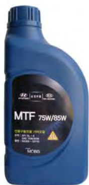
1 л - 04300-00110

Всесезонное полусинтетическое трансмиссионное масло, совместимо со всеми материалами уплотнений и эластомерными материалами, а также с металлами и сплавами, используемыми в трансмиссиях автомобилей Hyundai и Kia. Тщательно подобранный высокоэффективный пакет присадок и синтетическая технология производства базовых масел позволяют сохранять исключительную текучесть при низких температурах и прекрасные синхронизирующие свойства в различных эксплуатационных условиях, одновременно обеспечивая лёгкое переключение передач. Продукт обладает великолепными вязкостными и противоизносными характеристиками, благодаря новейшей технологии присадок обеспечивает сверхвысокую защиту от износа в широком диапазоне температур. Обеспечивает очень легкое переключение передач, обладает высокими синхронизирующими свойствами одновременно с надежной защитой от износа гипоидных и цилиндрических передач. Обладает превосходными низкотемпературными свойствами, гарантирует смазывание всех пар трения даже при очень низких температурах. Высокие антиокислительные свойства гарантируют чистоту деталей трансмиссии.