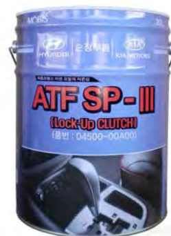
20 л - 04500-00A00