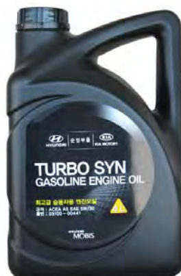
4 л - 05100-00441