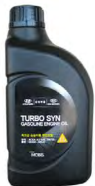
1 л - 05100-00141