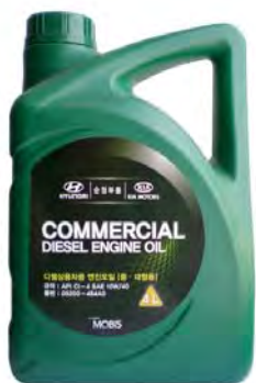
4 л - 05200-484A0

Высококачественное полусинтетическое масло для дизельных моторов легковых и грузовых автомобилей, в том числе оснащенных турбонаддувом, интеркулером или непосредственным впрыском. Производится на основе базового масла, полученного по технологии гидрокрекинга — использование данной технологии позволяет обеспечить высочайший уровень эксплуатационных и защитных свойств и соответствует самым высоким требованиям современных высоконагруженных дизельных двигателей. Гидрокрекинговое базовое масло сочетается с передовой системой присадок, что позволяет достичь высокого уровня защиты всех частей двигателя. Данное моторное масло обладает очень высокими эксплуатационными свойствами, специально создано для обеспечения исключительной защиты современных высокофорсированных дизельных двигателей. Подходит для использования в высокомоощных двигателях, работающих в тяжелонагруженных дорожных и внедорожных машинах.