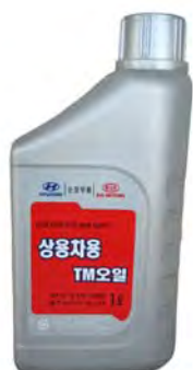
1 л - 04300-5L1A0