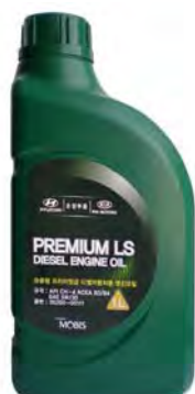
1 л - 05200-00111

Полусинтетическое моторное масло для дизельных двигателей. Предотвращает образование нагара, окисление и коррозию. Обладает хорошими моющими свойствами. Категория API CH-4.