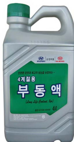
4 л - 07100-00400

Оформить заказ на основании оригинальных номеров Hyundai Kia Вы можете на нашем сайте www.oem-oil.ru или обратившись к закреплённому за Вами менеджеру.