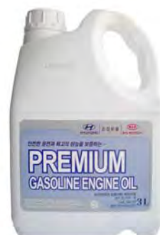
Оригинальный номер 3 л - 05100-00321