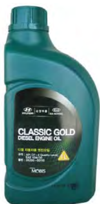
1 л - 05200-00110

Высококачественное моторное масло для дизельных двигателей, оснащенных турбиной и без нее. Разработано специально для дизелей HYUNDAI и KIA. Предотвращает образование нагара, окисление и коррозию. Обладает хорошими моющими свойствами. Категория API CF-4.