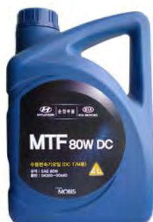
4 л - 04300-00440

Минеральное трансмиссионное масло для МКПП и раздаточных коробок автомобилей HYUNDAI и KIA.