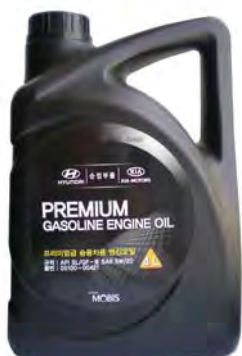
Оригинальный номер 4 л - 05100-00421