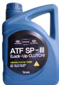
4 л - 04500-00400