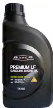
1 л - 05100-00151

Синтетическое моторное масло с улучшенными эксплуатационными характеристиками. Рекомендуется для всех типов бензиновых двигателей концерна Hyundai Kia выпущенных после 2005 года в качестве особенно рекомендуемого. Обязательно к применению для обеспечения устойчивой работы двигателей с CVVT (система изменения фаз газораспределения выпуска компании Hyundai), начиная с моделей двигателей 2L Beta I4 (автомобили Hyundai Elantra и Kia Spectra с 2005 года выпуска), Alpha II DOHC (автомобили Hyundai Accent/Verna, Tiburon, Kia cee'd с 2006 года выпуска).