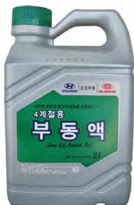
2 л - 07100-00200

Эффективная защита от кавитации и коррозии алюминиевых радиаторов.