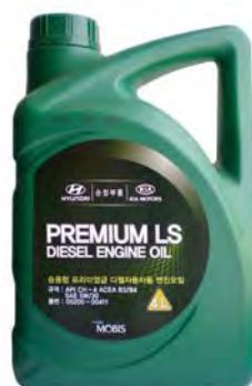
4 л - 05200-00411