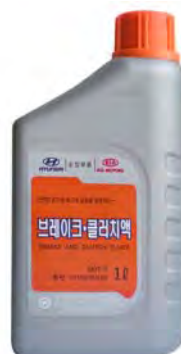
1 л - 01100-00100