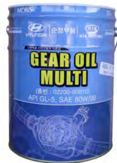
20 л - 02200-00B10

Всесезонное трансмиссионное масло для использования в широком ряде механизмов с прямыми, косыми и коническими шестернями, совместимо со всеми материалами уплотнений и эластомерными материалами, а также с металлами и сплавами, используемыми в трансмиссиях автомобилей Hyundai и Kia. Создано из минеральных масел высшей очистки, с использованием самых современных противоизносных, антифрикционных, антиокислительных, антипенных и других присадок. Специально подобранные компоненты обеспечивают легкое переключение передач трансмиссии и одновременно гарантируют высокую защиту от износа для шестерен и подшипников. Не образует пены и эмульсии, обеспечивает постоянную смазку и максимальный отвод тепла. Превосходные пластические свойства обеспечивают смазывание при больших удельных давлениях. Превосходная защита от износа, гарантирующая длительную живучесть частей (зубчатые колеса, подшипники, валы, переключатели, и т. п.). Особые вязкостно-температурные свойства этого масла позволяют использовать его всевозможно в широком интервале температур и обеспечивают текучесть при низких температурах. Высокий показатель вязкости гарантирует плавную работу элементов трансмиссии при любых температурах эксплуатации.