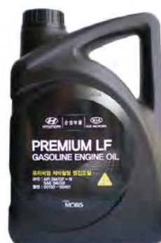
4 л - 05100-00451