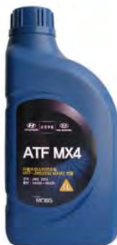
1 л - 04500-00130

Полусинтетическое масло для 4-х ступенчатых автоматических коробок передач JF402E и JF405E . Hyundai SANTRO 1.1L, Hyundai Atoz, KIA MORNING 1.0L и 1.1L, KIA PICANTO 1.0L и 1.1L, KIA VISTO 0.8L