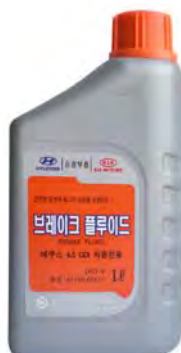
1 л - 01100-00110

Тормозная жидкость уровня качества DOT-4 для тормозных систем автомобилей Hyundai, KIA концерна Hyundai Motor Company (HMC).