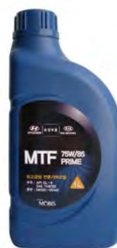
1 л - 04300-00140