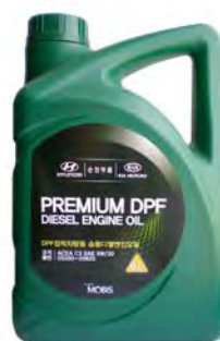
6 л – 05200-00620