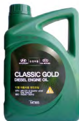
4 л - 05200-00410