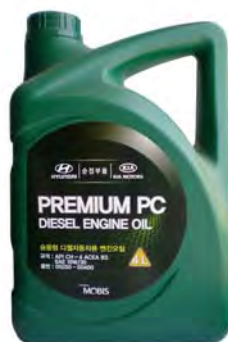
4 л - 05200-00400