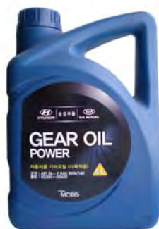
4 л - 02200-00420

Изготовлено на основе высокоочищенного минерального базового масла с добавлением комплекса специальных EP (Extreme Pressure) присадок. Надёжно защищает коробку передач и узлы трансмиссии легковых и грузовых автомобилей, внедорожной и специальной техники при экстремально тяжёлых условиях эксплуатации, включая эксплуатацию автотранспорта в условиях открытых карьеров. Обеспечивает долговременную защиту агрегатов строительной и грузовой техники в условиях высоких переменных нагрузок. Предназначено для современных коробок