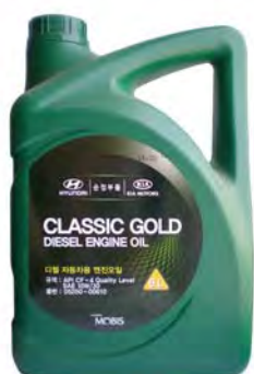
6 л – 05200-00610