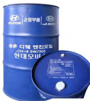
200 л – 05200-00C11