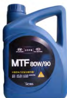
4 л - 04300-00460

Масло для механических трансмиссий SAE 80W-90 - универсальное трансмиссионное масло разработанное на основе высококачественных минеральных масел специально для работы в экстремальных условиях. Пакет самых современных присадок обеспечивает прекрасные вязкостно-температурные характеристики масла, что гарантирует эффективную работу узлов и деталей как механических трансмиссий, так и ведущих мостов автомобилей HYUNDAI и KIA. Класс по API GL-4.