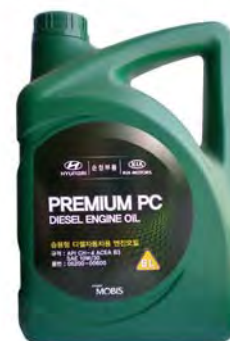
6 л - 05200-00600