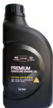
Оригинальный номер 1 л - 05100-00121

Полусинтетическое моторное масло с улучшенными эксплуатационными характеристиками. Рекомендуется для всех типов бензиновых двигателей концерна Hyundai Kia выпущенных после 2005 года в качестве особенно рекомендуемого. Обязательно к применению для обеспечения устойчивой работы двигателей с CVVT (система изменения фаз газораспределения выпуска компании Hyundai), начиная с моделей двигателей 2L Beta I4 (автомобили Hyundai Elantra и Kia Spectra с 2005 года выпуска), Alpha II DOHC (автомобили Hyundai Accent/Verna, Tiburon, Kia cee'd с 2006 года выпуска). Содержит тщательно подобранные присадки для достижения оптимальных эксплуатационных характеристик. Его смазывающие свойства сохраняются даже при интенсивном вождении благодаря качеству используемого базового масла и присадок. Противостоит отложению сажи и нагара, способствует содержанию двигателя в чистоте и обеспечивает отличное состояние сальников. Гарантирует лёгкий запуск и смазывание двигателя в холодную погоду и представляет собой минеральное масло исключительного качества с превосходными эксплуатационными характеристиками. Масло с добавлением высококачественных присадок, поддерживает превосходные эксплуатационные характеристики двигателя и малый расход топлива, поэтому является самым распространенным маслом. Категория API SL, ILSAC GF-3.