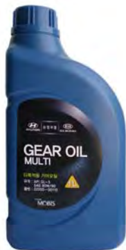
1 л - 02200-00110