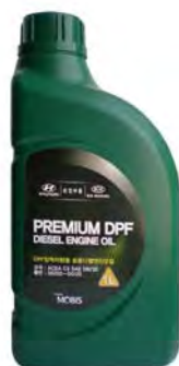
1 л - 05200-00120

Новейшее синтетическое беззольное моторное масло разработано эксклюзивно для HYUNDAI и KIA для новейших дизельных двигателей выпуска с 2007/08 года. Разработано для обеспечения оптимального срока службы сажевого фильтра в дизельных двигателях. Это масло рекомендуется для всех дизельных двигателей с сажевым фильтром. Соответствует высоким на сегодняшний день требованиям HYUNDAI и KIA к качеству. Категория ACEA C3.