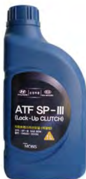
1 л - 04500-00100

Полусинтетическое трансмиссионное масло для большинства четырёх и пятиступенчатых АКПП автомобилей HYUNDAI и KIA. Обеспечивает плавное переключение передач в широком диапазоне температур, обладает стабильностью фрикционных свойств, высокой текучестью при низких температурах, хорошей совместимостью с большинством изделий из металлов и эластомеров, обеспечивает защиту от протечек и износа.