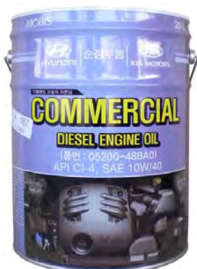
20 л - 05200-48BA0