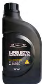
Оригинальный номер 1 л - 05100-00110

Полусинтетическое моторное масло с улучшенными эксплуатационными характеристиками. Рекомендуется для всех типов бензиновых двигателей концерна Hyundai Kia в которых автопроизводитель рекомендует применять масла с вязкостью SAE 5W-30 и уровнем качества API SL и ILSAC GF-4. Содержит тщательно подобранные присадки для достижения оптимальных эксплуатационных характеристик. Его смазывающие свойства сохраняются даже при интенсивном вождении благодаря качеству используемого базового масла и присадок. Противодействует отложению сажи и нагара, способствует содержанию двигателя в чистоте и обеспечивает отличное состояние сальников. Гарантирует лёгкий запуск и смазывание двигателя в холодную погоду и представляет собой минеральное масло исключительного качества с превосходными эксплуатационными характеристиками. Масло с добавлением высококачественных присадок, поддерживает превосходные эксплуатационные характеристики двигателя и малый расход топлива, поэтому является самым распространенным маслом. Категория качества API SL, ILSAC GF-3.