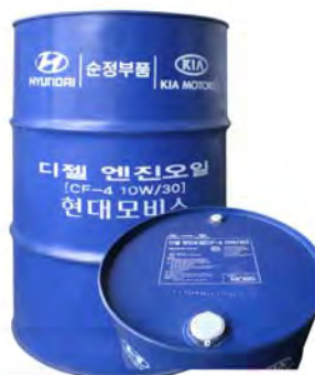
200 л – 05200-00C10