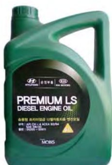
6 л – 05200-00611