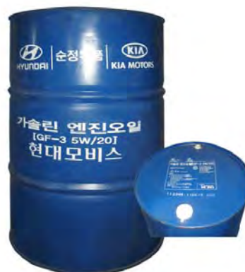
Оригинальный номер 200 л – 05100-00C21