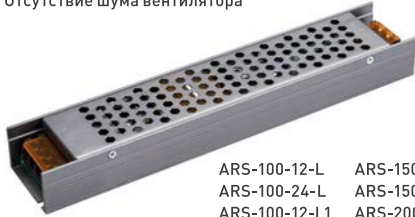
ARS-100-12-L ARS-150-12-L ARS-100-24-L ARS-150-24-L ARS-100-12-L1 ARS-200-12-L ARS-100-24-L1 ARS-200-24-L