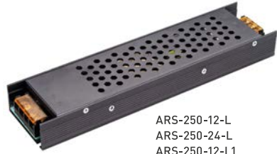
ARS-250-12-L ARS-250-24-L ARS-250-12-L1 ARS-250-24-L1