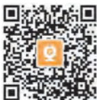
IOS и Android

Нажмите «Загрузить», чтобы установить приложение.