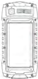
рисунок 4 12