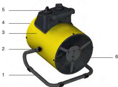
Рис. 1. Устройство прибора

Несущая конструкция тепловентилятора (см. рис.1) состоит из корпуса (1), изготовленного из листовой стали и имеющего цилиндрическую форму. В корпусе размещены вентилятор и трубчатые электронагревательные элементы. Снаружи корпуса расположен блок управления (2). Корпус, закрытый воздухозаборной (3) и воздуховыпускной (4) решетками, винтами устанавливается к ручке-подставке (5) и имеет возможность поворота в вертикальной плоскости. Угол поворота фиксируется винтами (6). Вентилятор затягивает воздух через отверстия воздухозаборной решетки. Воздушный поток, втянутый вентилятором в корпус, проходя между петлями трубчатых электронагревательных элементов, нагревается и подается в помещение через отверстия воздуховыпускной решетки.