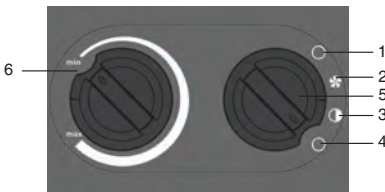
Рис. 2. Блок управления