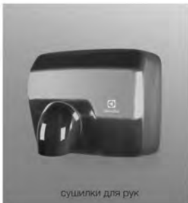
СУШИЛКИ ДЛЯ РУК