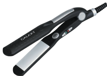
GL4501 ЩИПЦЫ ДЛЯ ВОЛОС