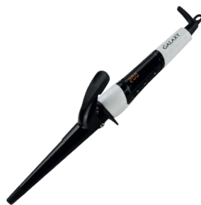
GL4614 ПЛОЙКА КОНУСНАЯ