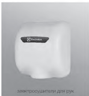
электросушители для рук