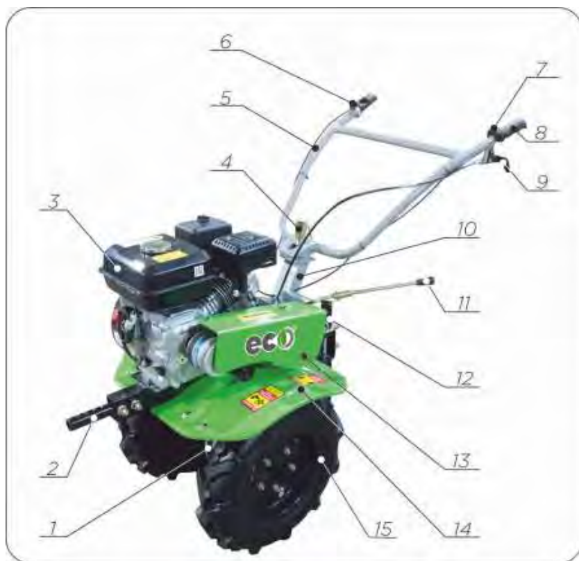
Рис.1 Мотоблок (общий вид)