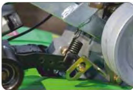
Рис. 11 (Кожух защитный снят)