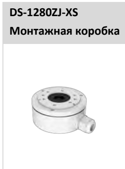
DS-1280ZJ-XS Монтажная коробка