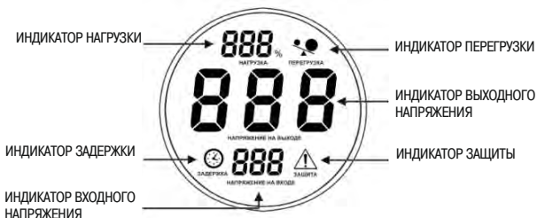
Рисунок 3 – Индикация режимов работы стабилизаторов

3.5 На передней панели корпуса стабилизатора расположен дисплей, отображающий режимы работы. Значение выходного напряжения отображается с точностью, указанной в таблице 2.