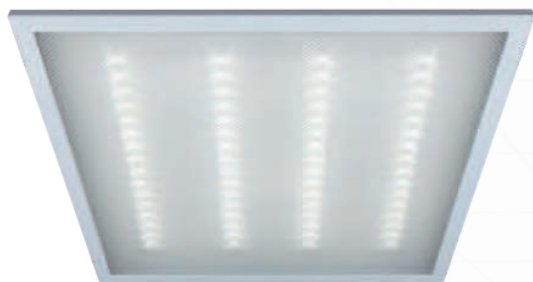
PPL 595/U PRISMA

Изготовлен из материала класса V2, препятствующего возможности возникновения горящих капель. Рассеиватель не поддерживает горение, при этом коэффициент пропускания света остаётся на прежнем высоком уровне.