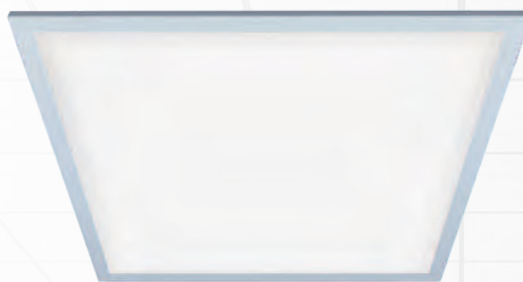
PPL 595/U OPAL

Встроенный драйвер входит в комплект поставки