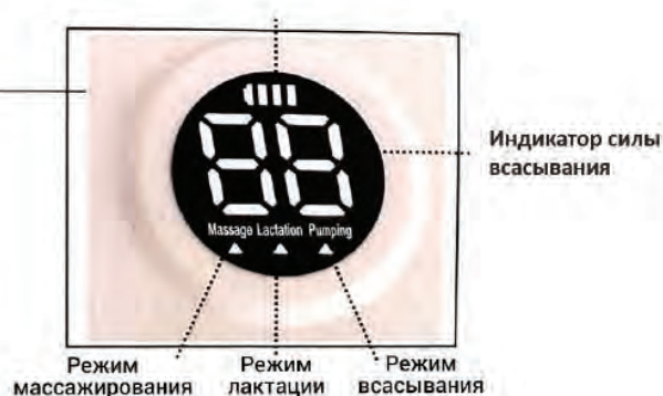
Жидкокристаллический дисплей Индикатор заряда аккумулятора