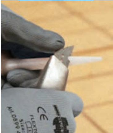
Отрезание носика в соответствии с размером швов

Срок годности Primer FD , при хранении в сухом и прохладном месте (максимальная температура +25^{\circ}\text{C} ), равен 6 месяцам.