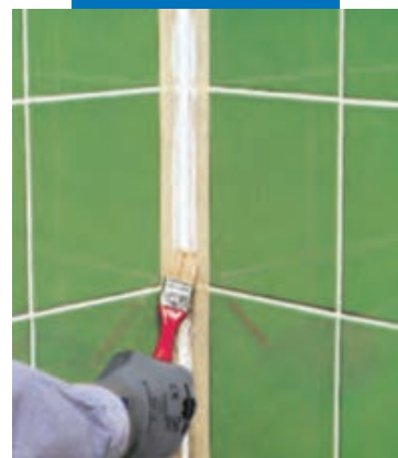
Заглаживание шва кисточкой, смоченной в мыльной воде