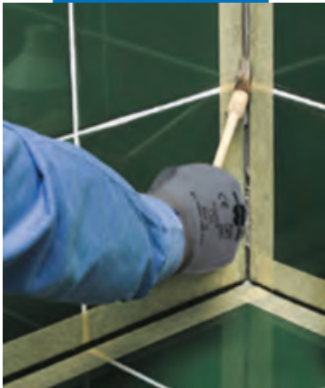
Нанесение Primer FD