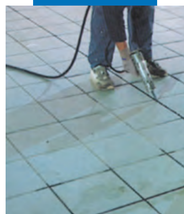
Герметизация швов в плитке посредством Mapesil AC