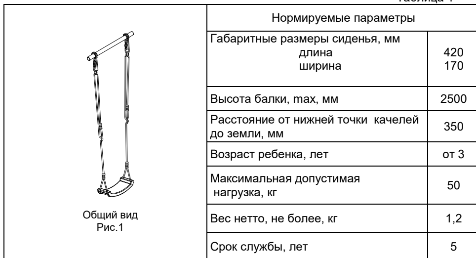
Общий вид Рис.1