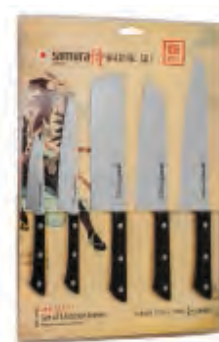
SHR-0250B НАБОР ИЗ ПЯТИ НОЖЕЙ SHR-0011B, SHR-0023B, SHR-0043B, SHR-0085B, SHR-0095B