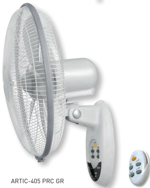
ARTIC-405 PRC GR

Настенные вентиляторы ARTIC PM/PRC GR обладают низким уровнем шума, имеют три скорости вращения и таймер.