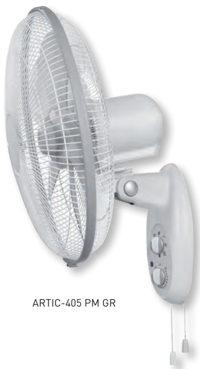
ARTIC-405 PM GR