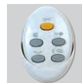
Artic-405 PRC GR Дистанционный пульт управления.