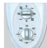
Artic 405 PM GR Переключатель скоростей и таймер.