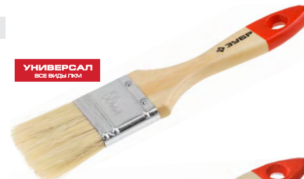
УНИВЕРСАЛ ВСЕ ВИДЫ ЛКМ