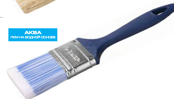
АКВА ЛКМ НА ВОДНОЙ ОСНОВЕ

16-0183 / www.zubr.ru / *Данный артикул представлен на фото. Упаковка: бумажная этикетка.