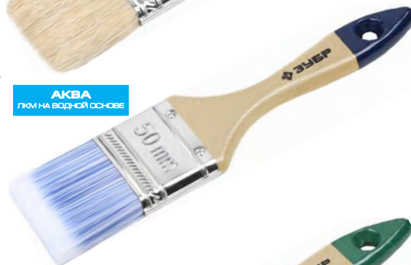
АКВА ЛКМ НА ВОДНОЙ ОСНОВЕ