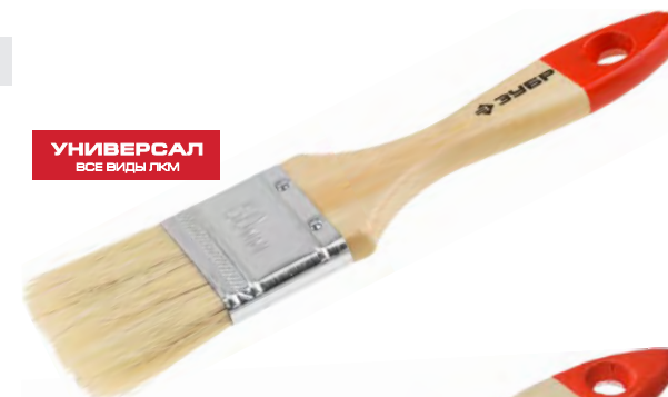
УНИВЕРСАЛ ВСЕ ВИДЫ ЛКМ