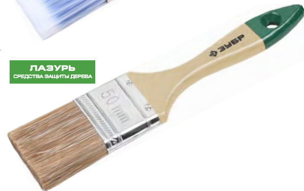
ЛАЗУРЬ СРЕДСТВА ЗАЩИТЫ ДЕРЕВА