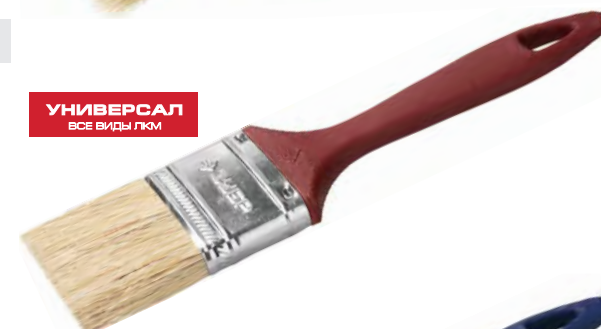
УНИВЕРСАЛ ВСЕ ВИДЫ ЛКМ