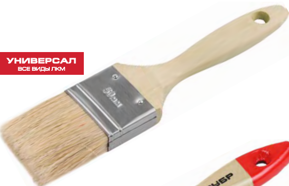
УНИВЕРСАЛ ВСЕ ВИДЫ ЛКМ