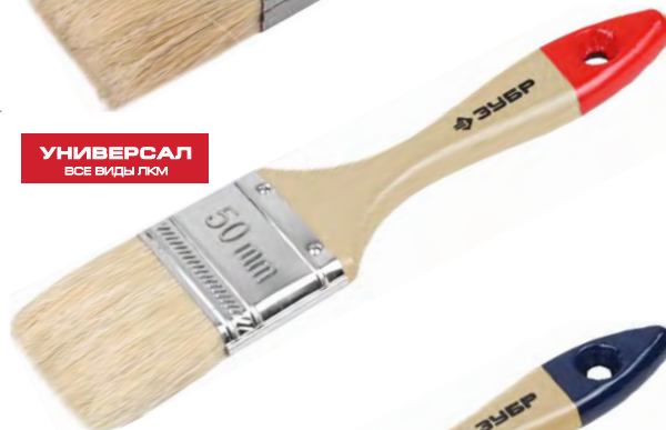
УНИВЕРСАЛ ВСЕ ВИДЫ ЛКМ