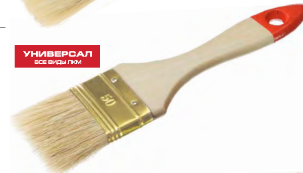
УНИВЕРСАЛ ВСЕ ВИДЫ ЛКМ