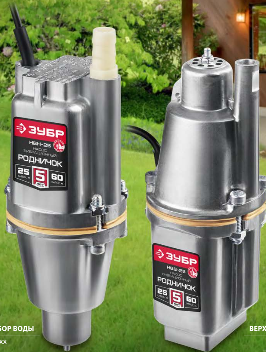
НИЖНИЙ ЗАБОР ВОДЫ НВН-xx