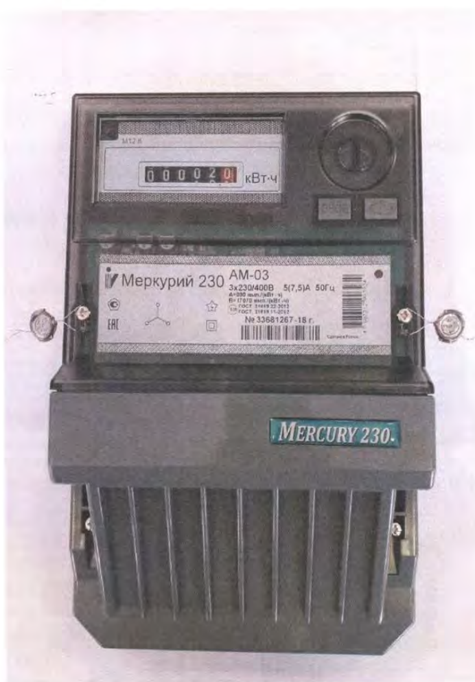
Рисунок 1- Общий вид счетчика с закрытой клеммной крышкой

Общий вид счётчиков электрической энергии трёхфазных статических «Меркурий 230АМ» представлен на рисунке 1.