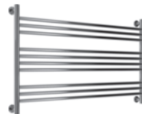
Рис. 4 «Богема L»