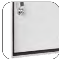
Герметичный уплотнитель на дверце и пыле-влагозащищенный замок