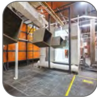
Атмосферостойкая порошковая краска

Щиты с монтажной панелью ЩМП и ЩМПг EKF PROxima являются надежной оболочкой для сборки щитов управления, автоматизации и пунктов распределения. Возможна установка различного модульного и силового оборудования. Сфера применения разнообразна: от жилого сектора до промышленности. Электрощиты изготовлены из российской стали, соответствующей ГОСТ 1050-88. Сборка корпусов осуществляется методом сварки, что обеспечивает их высокую жесткость и герметичность соединения частей. Монтажная панель выполнена съемной, что облегчает процесс монтажа оборудования. Электрощиты защищены от коррозии и разрушающего воздействия погодных факторов благодаря фосфатированию и использованию атмосферостойкой порошковой краски.