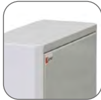
Качественный сварной корпус