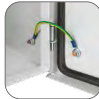
Обмедненные шпильки. Закрепленный поводок заземления