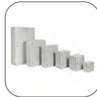
Большой выбор типоразмеров и комплектаций