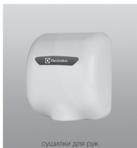
сушилки для рук