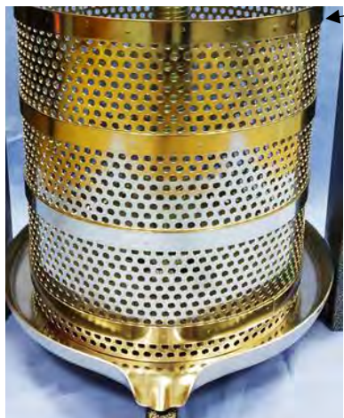
Рис. 2 Установка корпуса

7.2. Установить корпус в тарелку как показано на рис. 2 ободом вверх.