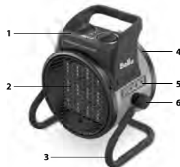
Рис. 1. Устройство прибора

При срабатывании термopредохранителя и отключении тепловентилятора из-за перегрева, он автоматически включится через несколько минут.