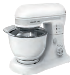
GL2230 ПЛАНЕТАРНЫЙ МИКСЕР