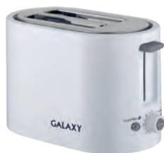
GL2908 ТОСТЕР ЭЛЕКТРИЧЕСКИЙ