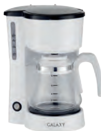
GL0709 КОФЕВАРКА ЭЛЕКТРИЧЕСКАЯ