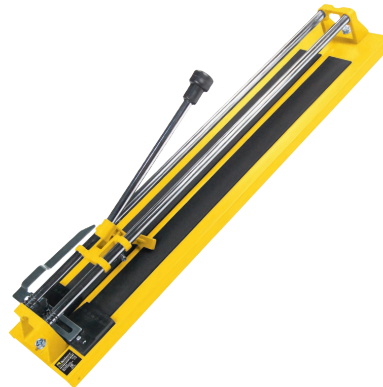
Плиткорез ручной KTC 600