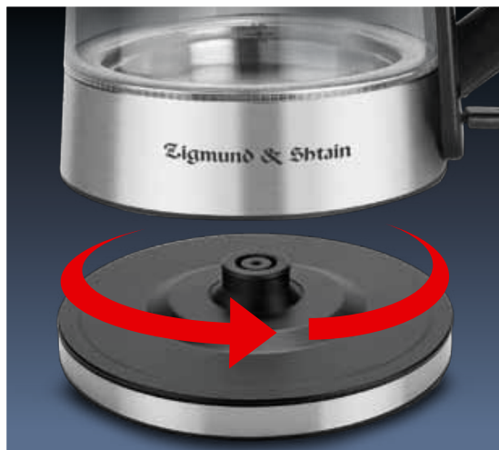
Поворотная база на 360°