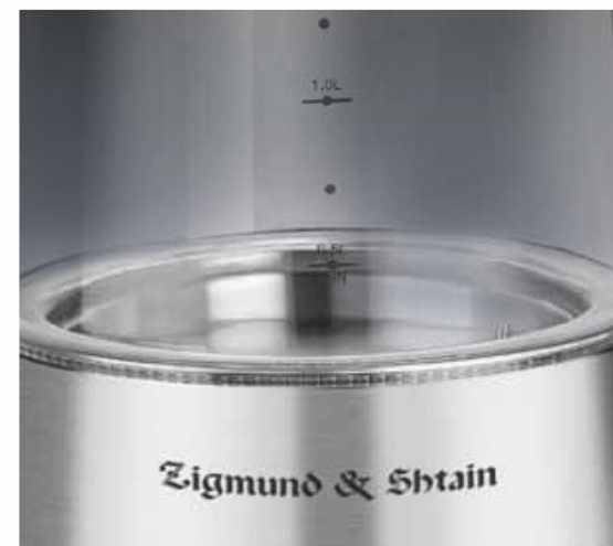
Закрытый дисковый стальной нагревательный элемент