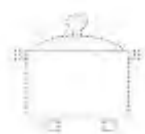
Посуда с ножками