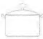
Посуда из керамики