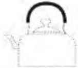
Посуда из алюминия

Индукционная плитка может распознавать многие виды посуды. Стекло, керамическая, медная, алюминиевая посуда, посуда с круглым дном, диаметром менее 12 см, посуда из немагнитной нержавеющей стали - является неподходящей. При обнаружении такой посуды плитка не нагревается и не может выполнять задаваемые операции.