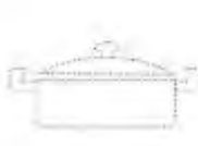
Посуда из термостойкого стекла