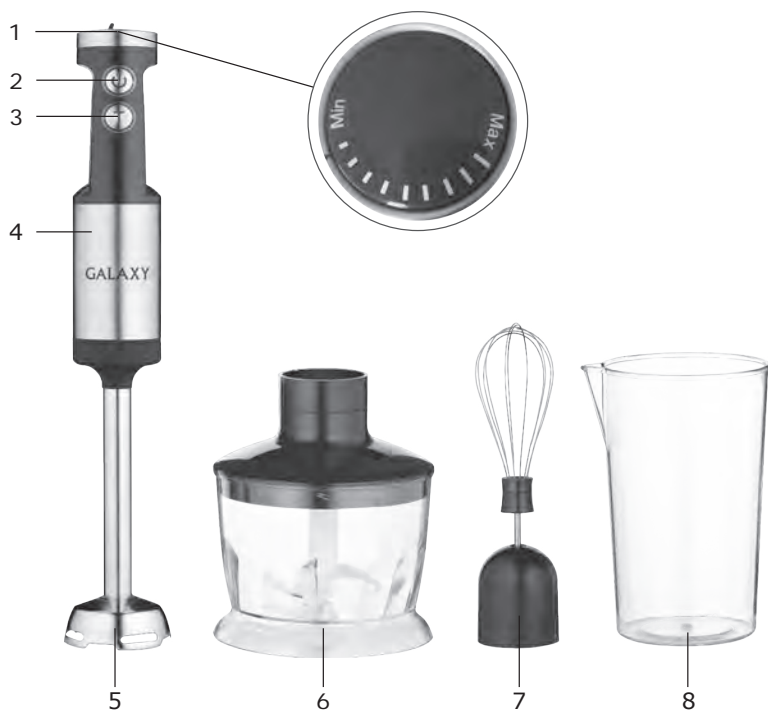
Элементы электроприбора (рис. 1):