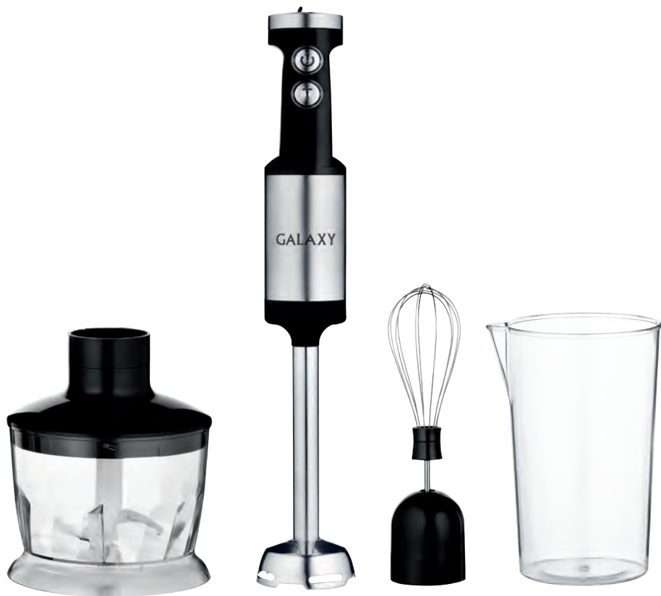
Блендерный набор Блендерлік жинақ