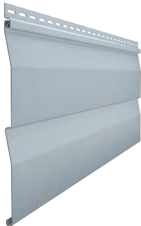
Сайдинг D4,5DL (корабельный брус, 4,5’')