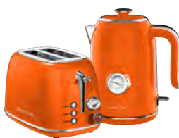
GL2921/ GL0351 АПЕЛЬСИНОВЫЙ ФРЕШ