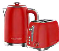
GL0349/ GL2919 ФЕРРАРИ