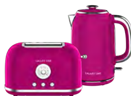
GL2916/ GL0346 МАЛИНОВЫЙ ДЖЕМ