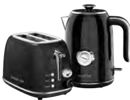
GL2920/ GL0350 МАГИЯ ЧЕРНОГО