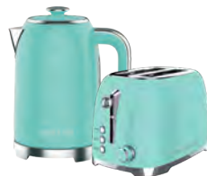
GL0347/ GL2917 ТИФФАНИ