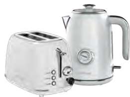
GL2922/ GL0352 СЛИВОЧНЫЙ ЗЕФИР