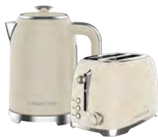
GL 0348/ GL2918 КРЕМ-БРЮЛЕ