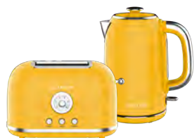
GL2915/ GL0345 БАНАНОВЫЙ ПУНШ