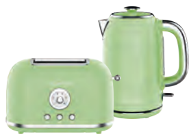
GL2911/ GL0344 РАЙСКАЯ ОЛИВА