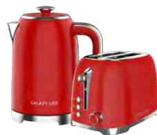
GL0349/ GL2919 ФЕРРАРИ