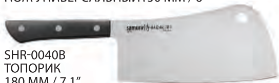
SHR-0040B ТОПОРИК 180 MM / 7.1"