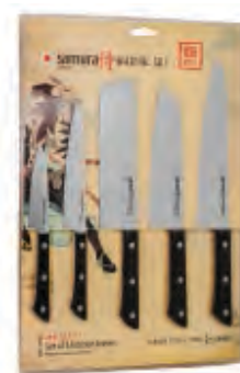
SHR-0250B НАБОР ИЗ ПЯТИ НОЖЕЙ SHR-0011B, SHR-0023B, SHR-0043B, SHR-0085B, SHR-0095B