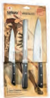
SHR-0230B НАБОР ИЗ ТРЕХ НОЖЕЙ SHR-0023B, SHR-0057B, SHR-0085B