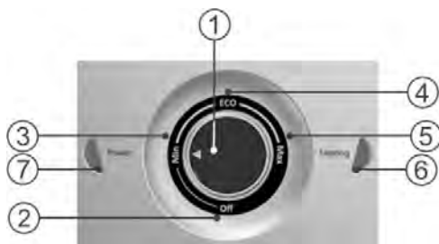
Рисунок 2. Механическая панель управления

Рисунок 2: 1 – ручка управления водонагревателем со стрелкой индикатором, 2 – зона «off» включения/выключения водонагревателя, 3 – зона регулировки температуры «min», 4 – зона регулировки температуры «eco», 5 – зона регулировки температуры «max», 6 – контрольная лампа «Heating», 7 – контрольная лампа «Power».