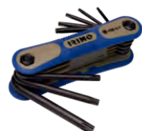
Футляр с шестигранными Г-образными ключами Torx, 8 шт., T9-T40 458-8-F