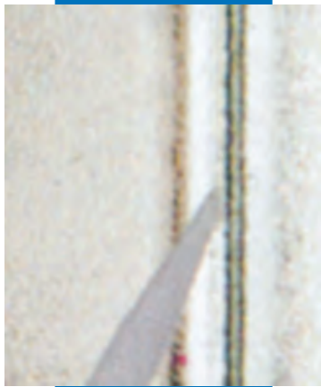
Герметизация U-образного стеклянного профиля