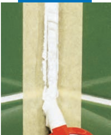
Нанесение Mapesil AC