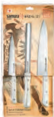
SHR-0230W НАБОР ИЗ ТРЕХ НОЖЕЙ SHR-0023W, SHR-0057W, SHR-0085W