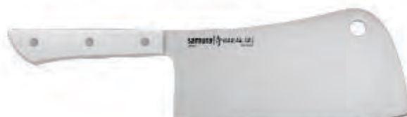
SHR-0040W ТОПОРИК 180 MM / 7.1"