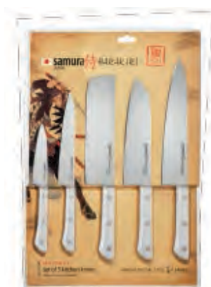
SHR-0250W НАБОР ИЗ ПЯТИ НОЖЕЙ SHR-0011W, SHR-0023W, SHR-0043W, SHR-0085W, SHR-0095W