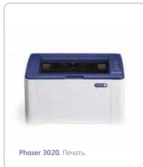
Phaser 3020. Печать.