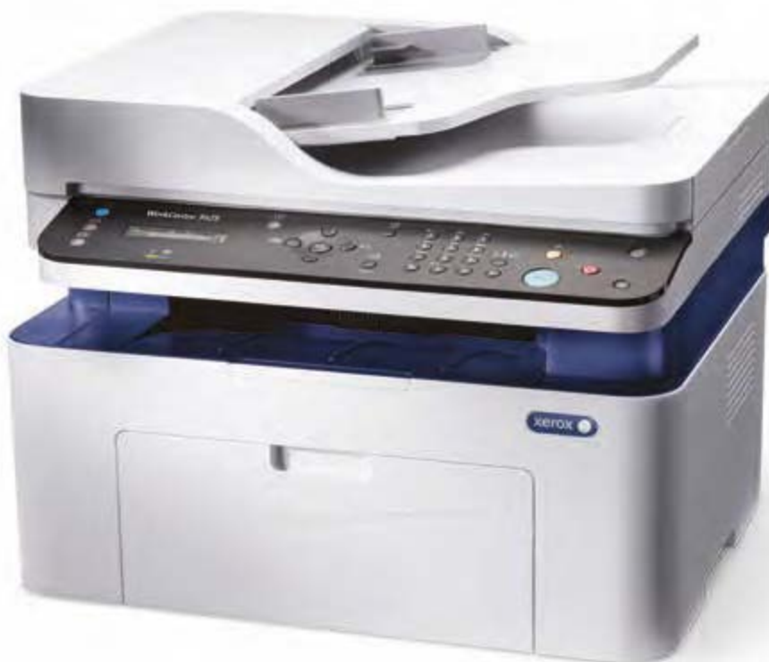
WorkCentre 3025. Копирование. Печать. Сканирование. Факс.*

* Факс и автоподатчик ADF предусмотрены только для модели WorkCentre 3025NI.