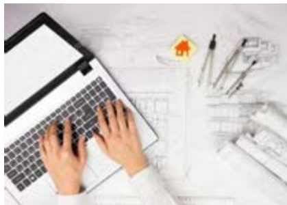
ФАЙЛЫ ДЛЯ ПРОФЕССИОНАЛОВ

Материалы доступны для скачивания по следующим ссылкам: