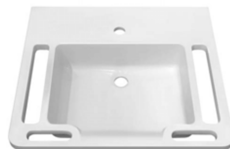
УМЫВАЛЬНИК CARE G 600