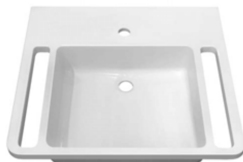
УМЫВАЛЬНИК CARE 600