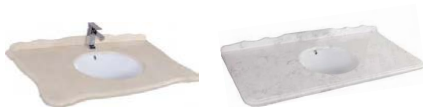
Раковины из санфаянса со столешницей из натурального мрамора

Литьевой мрамор - экологически чистый материал на основе натуральной мраморной крошки или кварцевого песка с полиэфирными связующими. Поверхность изделия покрыта защитным слоем - гелкоутом. В отличие от санфаянса литьевой мрамор поддается восстановлению и не нуждается в специальном уходе.