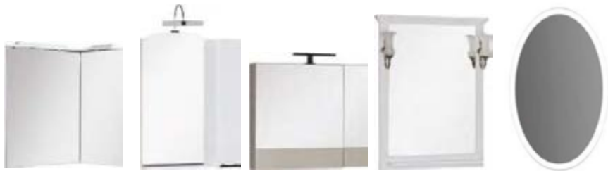
Зеркало со встроенным светильником

Зеркало (входит в набор) - обработанное зеркальное полотно на подложке разных типов. Зеркало для ванной комнаты может быть с подсветкой, встроенной в зеркальное полотно или представляющей собой навесной светильник с направленным светом. Выпускаются также зеркала в виде навесных шкафчиков разного размера. В классических моделях применяются парные бронзовые или серебряные светильники с плафонами из матового стекла, которые закрепляются на раме зеркала. Для стиля hi-tech подойдут зеркала со встроенной внутренней светодиодной подсветкой. Мы предлагаем большое количество типов зеркал, многие из которых универсальны и подходят к нескольким моделям.