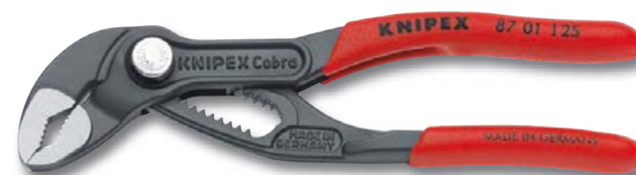
87 01 125 Рисунок 1:1