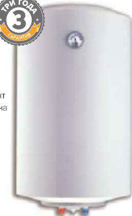
Ø438 СТАНДАРТНАЯ МОДЕЛЬ