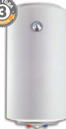
Ø368 УЗКАЯ МОДЕЛЬ