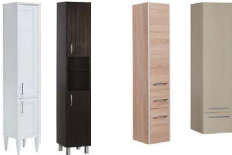
Пеналы (напольные, подвесные)

Пенал подвесной или напольный (приобретается отдельно) - корпусная конструкция с одним или несколькими фасадами, выдвижными ящиками или открытыми полками. Подвесные пеналы оснащаются регулируемыми навесами для крепления к стене, напольные пеналы комплектуются ножками. Конструкционные решения пеналов разнообразны, а дизайн пеналов всегда повторяет основные мотивы коллекции. В рамках одной коллекции может быть предложены два типа пеналов.