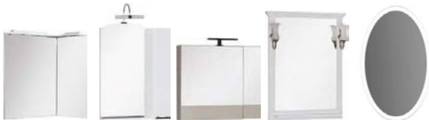
Зеркало со встроенным светильником

Зеркало (входит в набор) - обработанное зеркальное полотно на подложке разных типов. Зеркало для ванной комнаты может быть с подсветкой, встроенной в зеркальное полотно или представляющей собой навесной светильник с направленным светом. Выпускаются также зеркала в виде навесных шкафчиков разного размера. В классических моделях применяются парные бронзовые или серебряные светильники с плафонами из матового стекла, которые закрепляются на раме зеркала. Для стиля hi-tech подойдут зеркала со встроенной внутренней светодиодной подсветкой. Мы предлагаем большое количество типов зеркал, многие из которых универсальны и подходят к нескольким моделям.