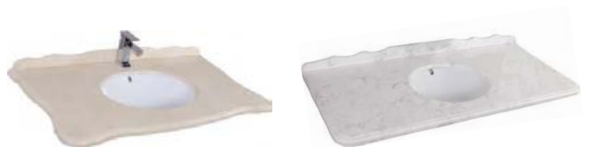
Раковины из санфаянса со столешницей из натурального мрамора

Литьевой мрамор - экологически чистый материал на основе натуральной мраморной крошки или кварцевого песка с полиэфирными связующими. Поверхность изделия покрыта защитным слоем - гелькоутом. В отличие от санфаянса литьевой мрамор поддается восстановлению и не нуждается в специальном уходе.