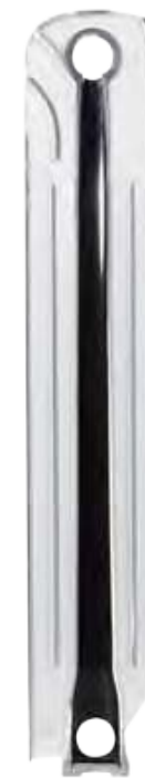
секция радиатора ALETERNUM® B4 в разрезе

Новое внутреннее покрытие ALETERNUM® радиаторов Fondital обеспечивает защиту от наиболее распространенных причин коррозии, которой подвержены обычные радиаторы. Преимущества радиатора ALETERNUM® B4 :