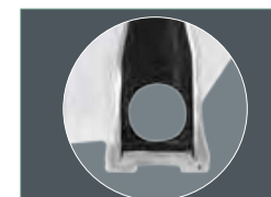
Новая заглушка Вид в разрезе