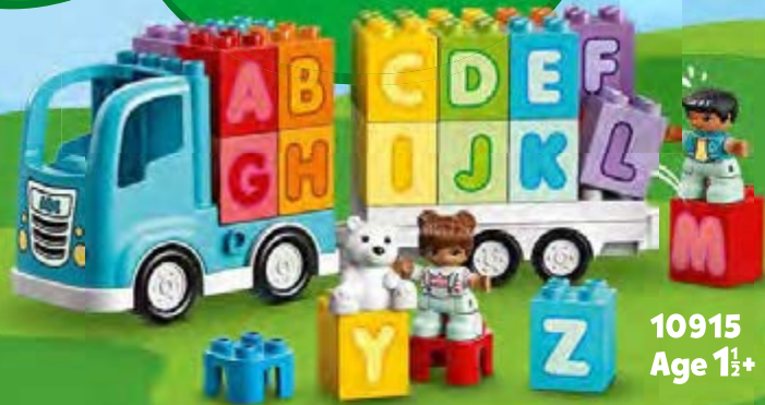
10915 Age 1½+