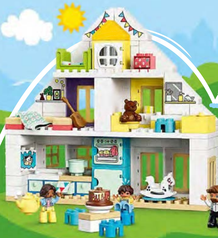
10929 Age 2+

Extra Ideas Included Mit zusätzlichen Bauiden Idées supplémentaires incluses Idee aggiuntive incluse Incluye ideas extra Inclui Ideias Extra Extra ötletek a csomagban lekjautas papírdú idejas 内含更多创意