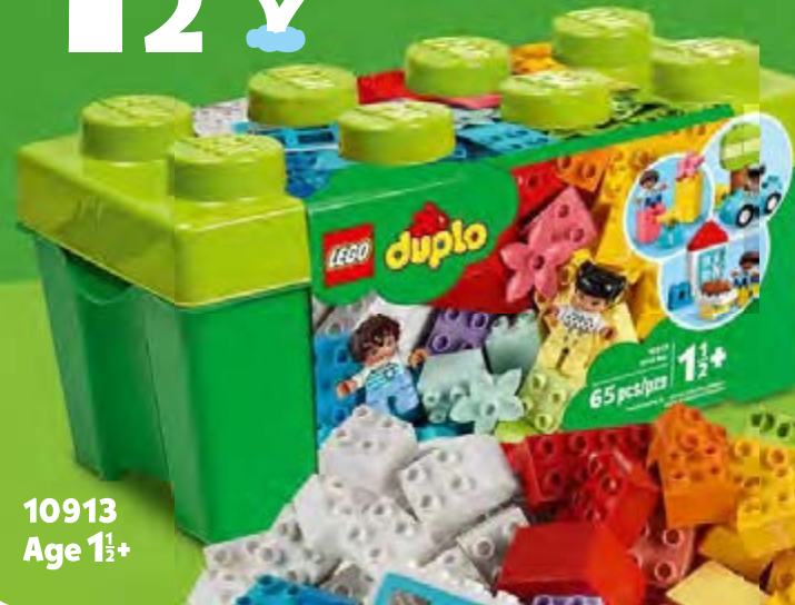
10913 Age 1½+